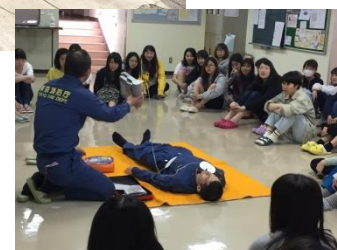
防災訓練は真剣に行っています