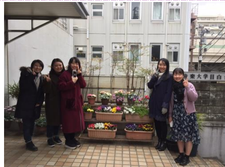
こんにちは、寮生会です！