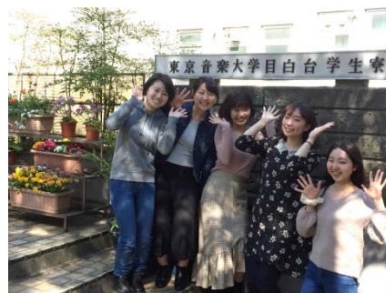
こんにちは、寮生会です！