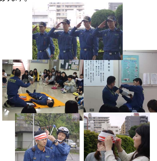
防災訓練は真剣に