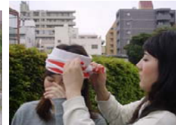
防災訓練は真剣に