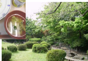
近隣・関口台公園