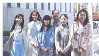
こんにちは、 学生支援課長と 寮生会です